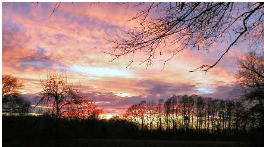
Los colores de puesta del sol