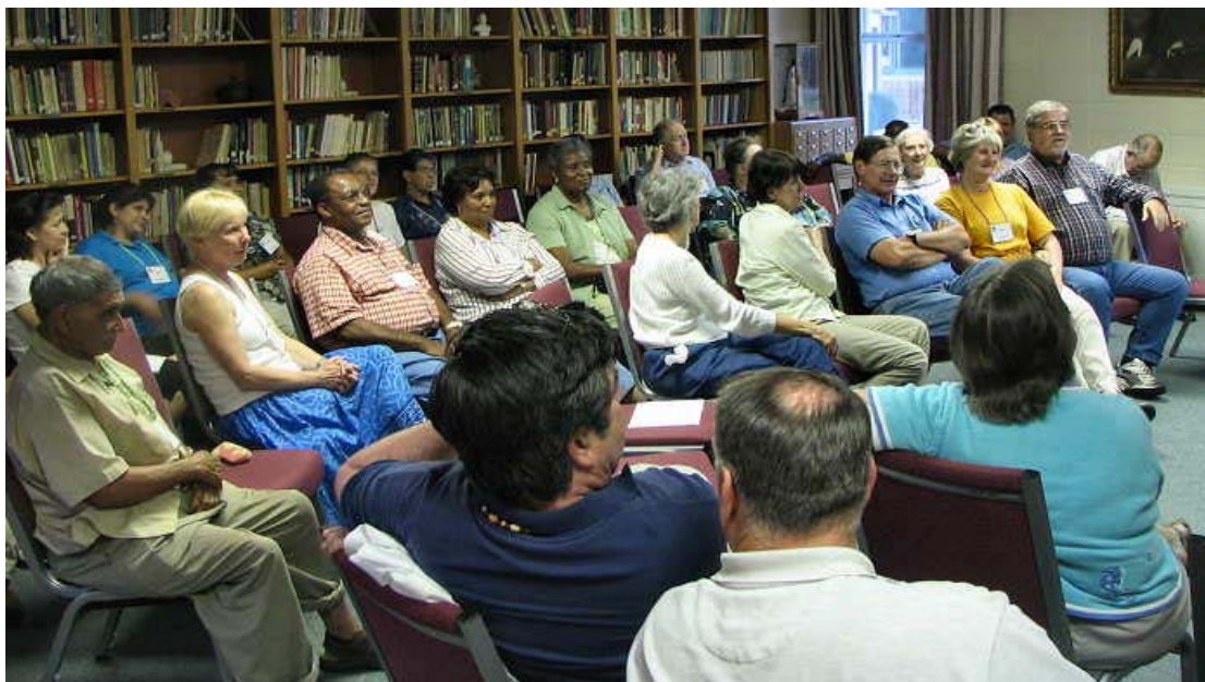
Los retiros anuales de Pentecostés en Holy Trinity, AL, en Mayo 2005.